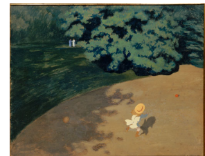
Le ballon Félix Vallotton 1899, Huile sur carton collé sur bois

Présenter chaque œuvre et demander aux enfants quel est le point commun entre ces œuvres ? Quel type de jeux voit-on dans ses œuvres ? Quels jeux connaissent-ils ? Quels jeux aiment-ils ? Quelles œuvres préfèrent-ils ? Les faire parler un maximum sur les œuvres.