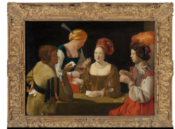
Le Tricheur à l'As de Carreau Georges de La Tour 1635, Huile sur toile