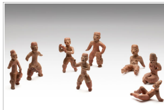
Joueurs de balle El Openo 1500 à 1200 av J.C Céramique polychrome