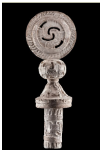
Tableau de scores pour jeu de balle 650 ap J.C Etat de Mexico Andésite Stuc et pigments