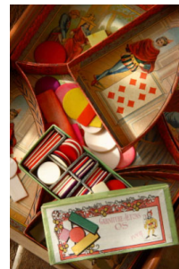
Jetons Jeu de nain jaune et pièces en os teinté Eric Van Ees Beek