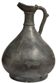
Oenochoé Céramique Pâte grise et couverte bleu-ardoise IIIe siècle après J.C