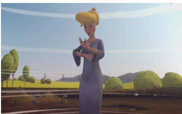
Autant en emporte le temps – durée 15 min Mathieu Rolin Pôle d'archéologie interdépartementale Rhénan, Amopix, Universcience

Deux archéologues remontent le temps jusqu'à l'âge de fer dans ce qui semble être les reliquats d'un village gaulois disparu.