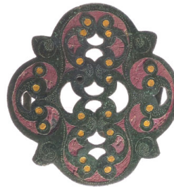
Plaque de harnais Alliage cuivreux, émail Paillart Ier siècle après J.C