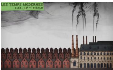
Petite histoire de l'habitat – durée 4,17 min Benjamin Gibeaux Universcience, La Main à la pâte

Deux archéologues remontent le temps jusqu'à l'âge de fer dans ce qui semble être les reliquats d'un village gaulois disparu.