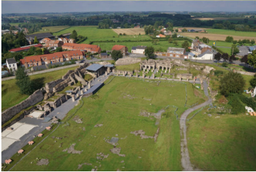
Forum romain et muraille du Bas Empire de Bavay