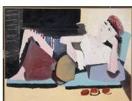
Femme au tambourin , 1925 Pablo Picasso (1881-1973)