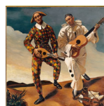
Arlequin et Pierrot , vers 1924 André Derain (1880-1954)

Quels sont les instruments présents dans les œuvres ? Ces tableaux se ressemblent-ils ?