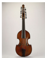
Viola d'amour 1753 Jean-Nicolas Lambert